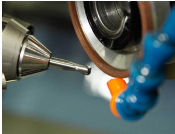
01 | 100% Qualität. Stück für Stück.