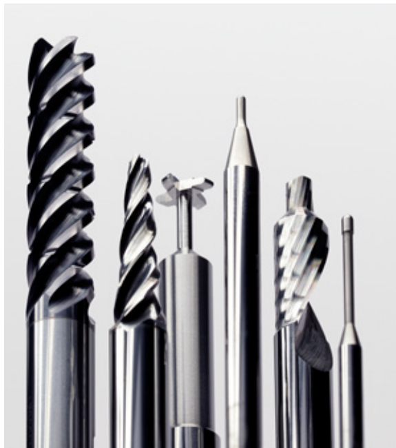
02 | Besondere Ansprüche. Spezielles Werkzeug-Design.