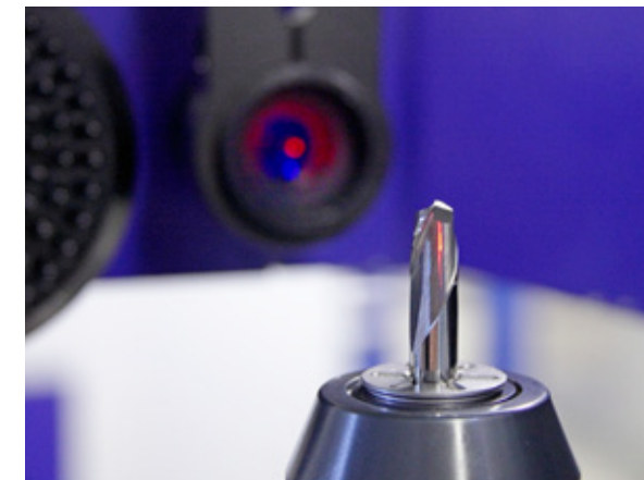
02 | Ultrapräzise Messtechnologie